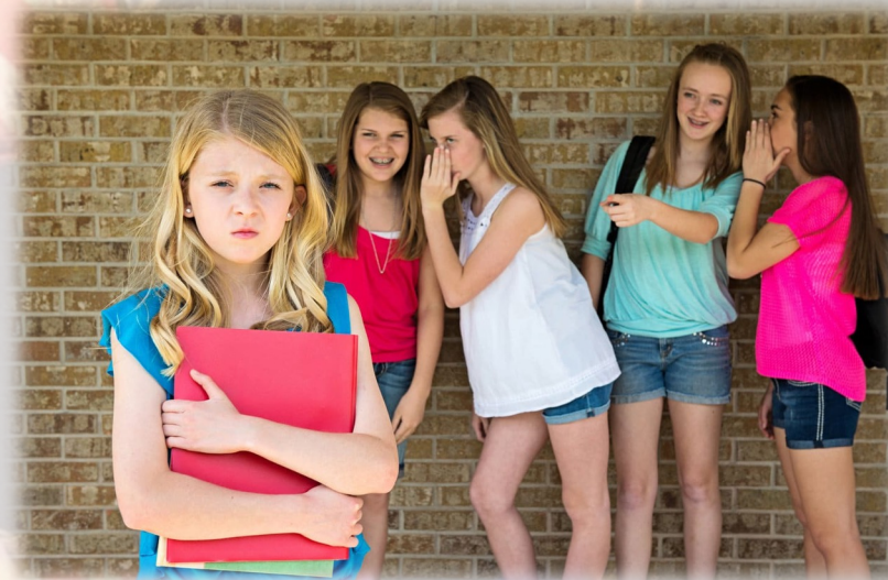
Le dinamiche di gruppo come dispositivo