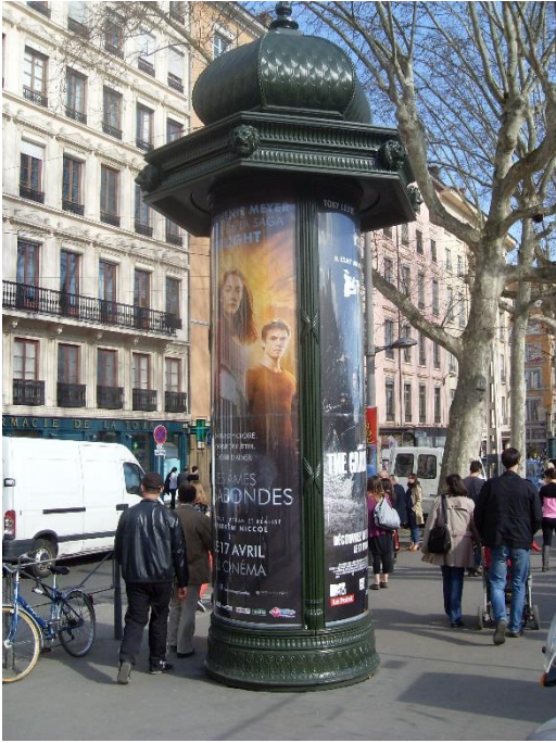
Une colonne Morris