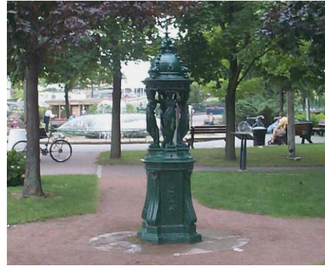
Une fontaine Wallace

Ecoutez l'histoire des arrondissements de Paris et répondez aux questions :